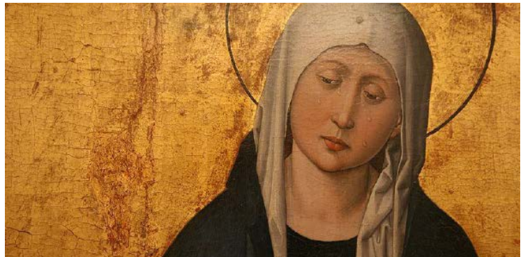
Descente croix de du retableum Stauffenberg (detail), 15. storočie